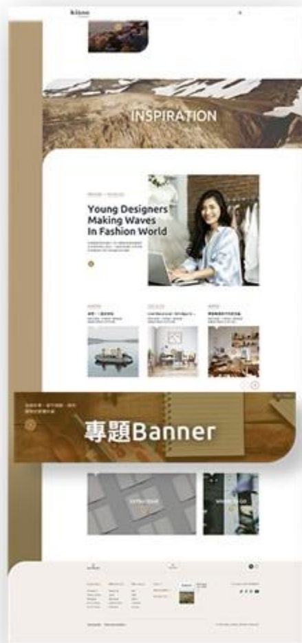
A 首頁 Home page