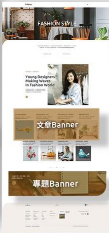
B 內頁 Inside page